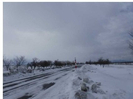
大潟村 マツ 整備後