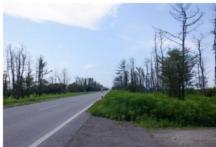
大潟村 マツ 整備前