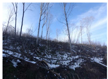
東成瀬村 ナラ 整備後