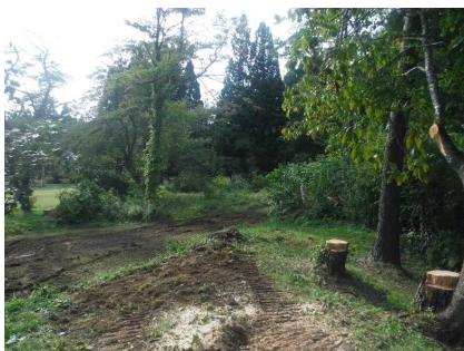
北秋田市 マツ 整備後